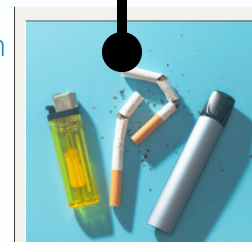
Nee tegen tabak

Longarts van de toekomst Zorgevaluatie agenda SKMS projecten