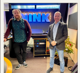
KINK FM actie