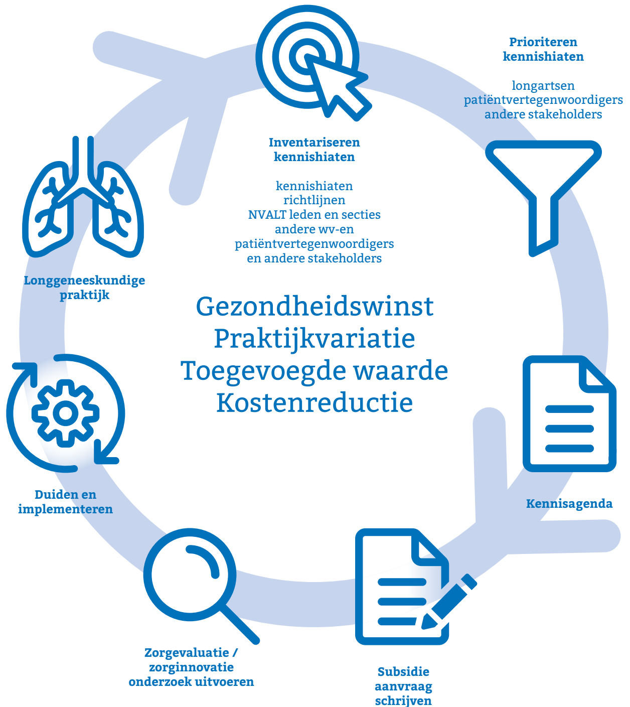
Figuur 1: Proces van zorgevaluatie voor de longeneeskundige praktijk